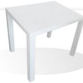
IF 06 COFFE TABLE 50X50X50 CM