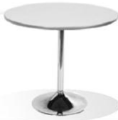
IF 05 ROUND TABLE DIA. 75X75 CM