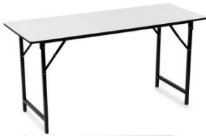
IF 07 WHITE TABLE 45 x 183 x 75 CM