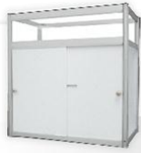
IF 01 COUNTER SHOWCASE 50X100X100 CM